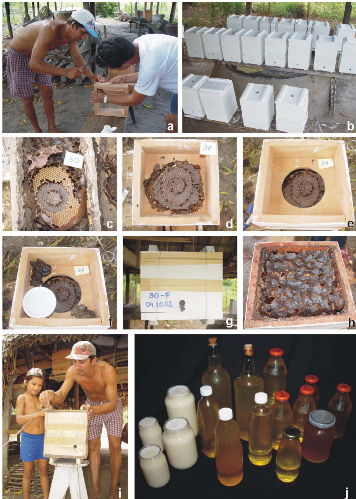
Figura 1. Transferência para caixa racional. a) montagem das caixas; b) caixas prontas, c) ninho em caixa cabocla; d) favos de cria no ninho; e) sobreninho colocado; f) sobreninho com alimentador, g) nova caixa no local definitivo: observar que nesta fase ainda não são colocadas as melgueiras, h) melgueira totalmente preenchida com potes de mel, i) a meliponicultura é de fácil assimilação pelos agricultores, e j) méis de abelhas indígenas: quando produzido de forma racional e acondicionado corretamente, resulta em um produto de excelente qualidade, alto valor nutricional e econômico.