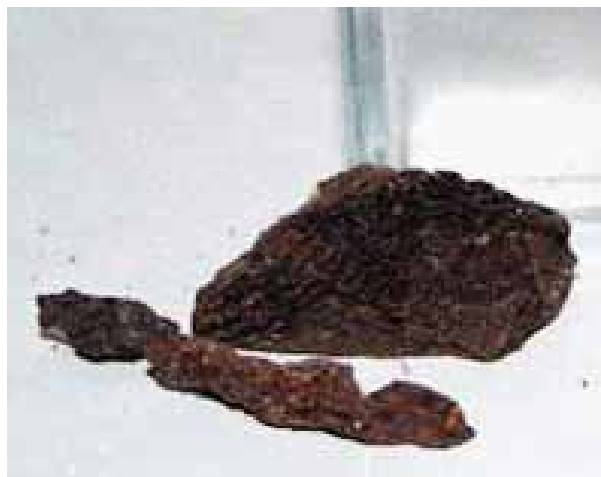
Figura 1. Geoprópolis de Melipona fasciculata Smith (tiúba).

Os EHAG foram submetidos à abordagem química para verificação de compostos das classes dos compostos fenólicos, alcalóides, terpenos e saponinas (Matos, 1997).